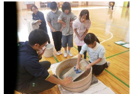
1月 昔の暮らし体験(3年)