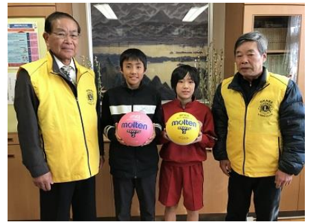
1月 (寄贈)岡部ライオンズクラブ様