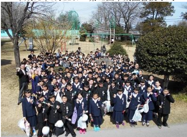
6年生48名の児童が本郷小学校を卒業し、中学校に進学しました。今後の更なる成長が楽しみです。